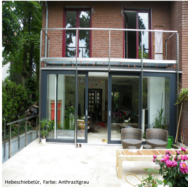
Hebeschiebetür, Farbe: Anthrazitgrau