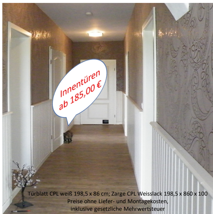
Türblatt CPL weiß 198,5 x 86 cm; Zarge CPL Weisslack 198,5 x 860 x 100 Preise ohne Liefer- und Montagekosten, inklusive gesetzliche Mehrwertsteuer