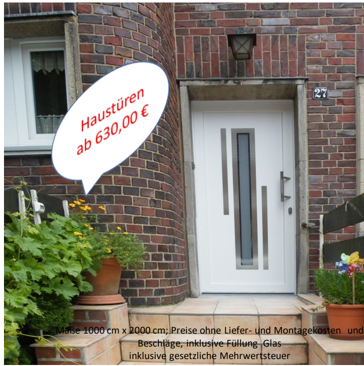
Masse 1000 cm x 2000 cm; Preise ohne Liefer- und Montagekosten und Beschläge, inklusive Füllung, Glas inklusive gesetzliche Mehrwertsteuer